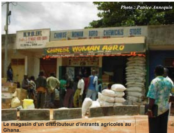
Le magasin d'un distributeur d'intrants agricoles au Ghana.

La nécessité du développement agricole s'avère critique au Ghana. Le pays a besoin de relancer sa productivité agricole pour augmenter les revenus des agriculteurs, satisfaire à la demande croissante de nourriture et renverser la tendance à l'épuisement rapide des éléments nutritifs du sol qui dégrade l'environnement. Présentement, environ 29% des Ghanéens vivent en dessous du seuil de pauvreté. Les femmes et les agriculteurs pauvres des zones rurales sont les plus touchés. Cette situation est partiellement due à la faible productivité agricole causée par la faible fertilité naturelle des terres ghanéennes et à une faible utilisation d'engrais (3,1kg d'élément nutritif par hectare). Les cadres de l'IFDC et leurs partenaires ghanéens impliqués dans ce nouveau projet espèrent rectifier cette situation. ♦