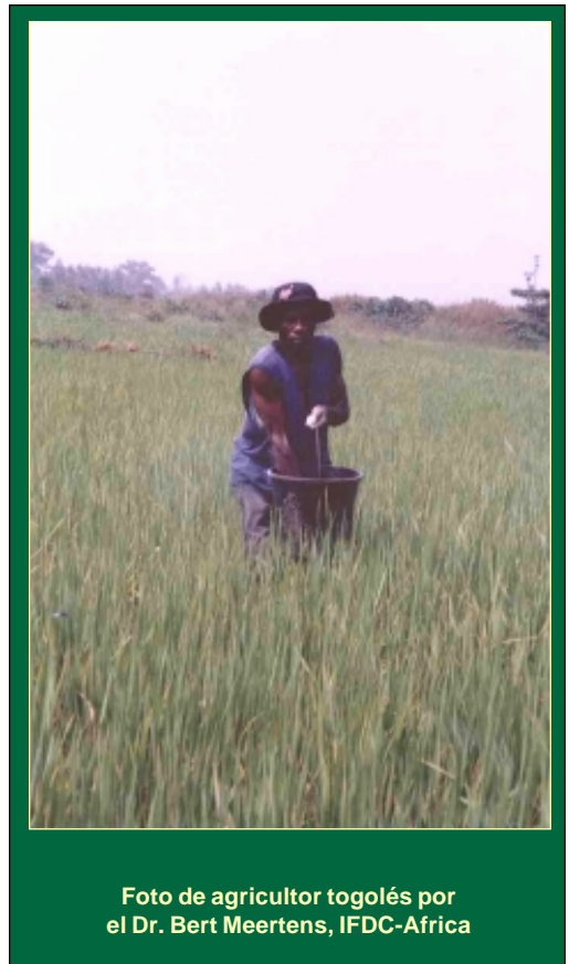
Foto de agricultor togolés