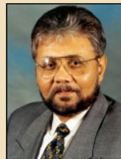
Dr. Amit H. Roy

Editor: Usted una vez declaró que “el IFDC se encuentra optimista que al (1) combatir los problemas agudos de fertilidad de suelos del Africa, (2) ayudar a desarrollar las políticas correctas, y (3) proveer acceso, a las herramientas para el desarrollo agrícola, podrán los agricultores del sub-Sahara africano transformar la agricultura de sus países. Con el continuo apoyo, logrará el IFDC vencer ese reto! ¿Podría usted dar ejemplos concretos de lo que el IFDC está logrando en estas tres áreas para lograr este anhelo africano?”