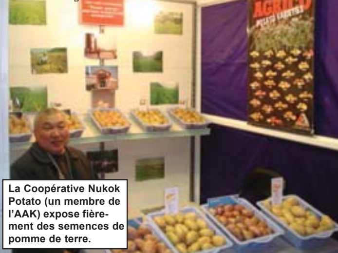
La Coopérative Nukok Potato (un membre de l'AAK) expose fièrement des semences de pomme de terre.