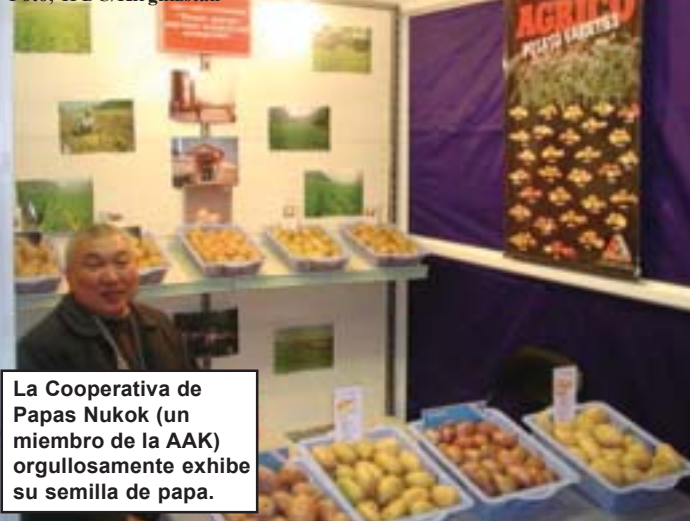
La Cooperativa de Papas Nukok (un miembro de la AAK) orgullosamente exhibe su semilla de papa.